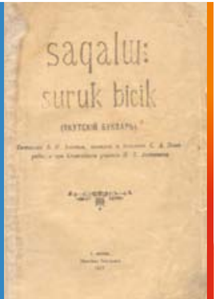
Букварь на якутском языке на основе алфавита С.А. Новгородова