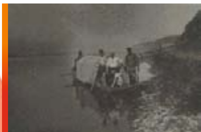
Отряд экспедиции при поездке на лодке по р. Лене. 1927 г.

За время существования ЯАССР республика стала регионом сплошной грамотности. На пике расцвета автономной Якутии в 1987 г. в республике действовало 690 общеобразовательных школ всех видов, где обучались почти 200 тыс. учащихся. В школах республики преподавание велось на русском, якутском, эвенкийском и эвенском языках.