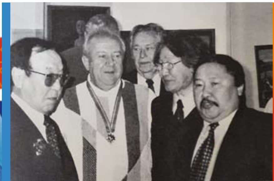
Художники Якутии с З. Церетели , президентом Российской академии художеств

За период ЯАССР появились и своими постановками, и спектаклями радовали жителей республики 5 государственных и 20 народных театров. Среди деятелей якутского театра широкую известность по всей стране получили народные артисты СССР В.В. Местников, Д.Ф. Ходулов, народные артисты РСФСР и РФ С.А. Григорьев, Т.П. Местников, П.М. Решетников, заслуженный деятель искусств РФ А.С. Борисов.