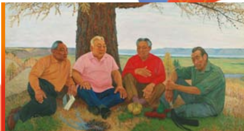
Картина А. Осипова «Народные писатели Якутии»