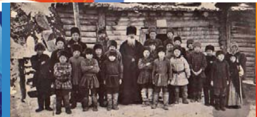
Учащиеся школы 1903 г. Якутия