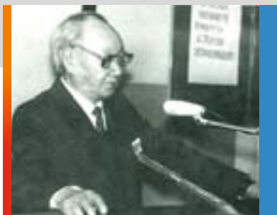
А.Е. Мординов Первый ректор ЯГУ