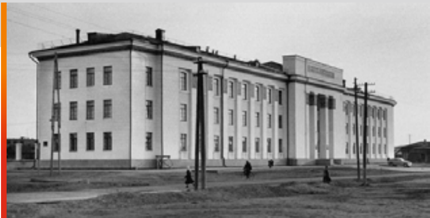
Здание Якутский филиал Академии Наук СССР