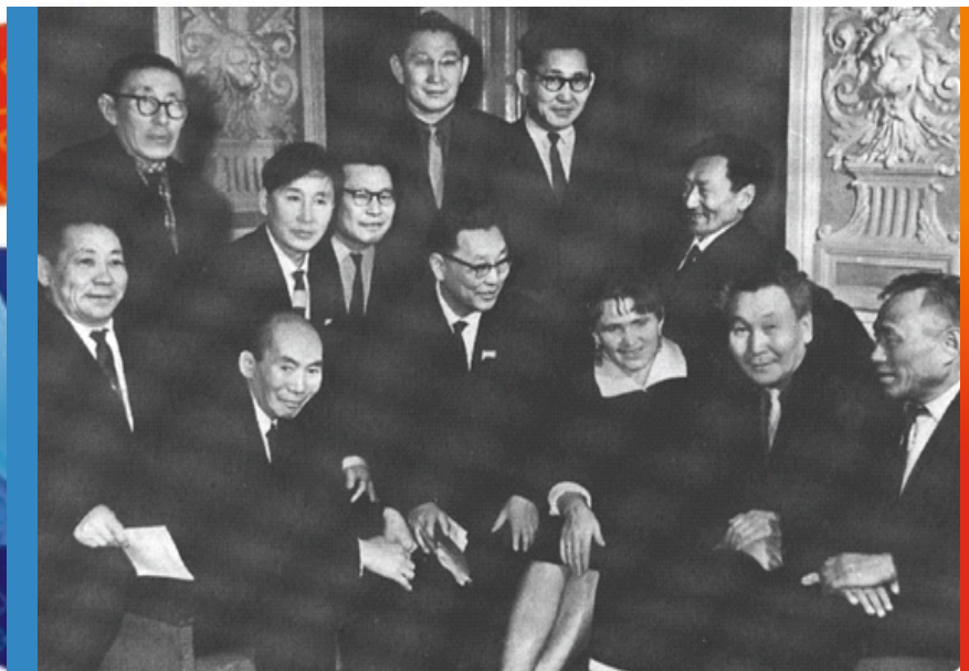
Делегаты и гости от Якутской писательской организации на II съезде писателей РСФСР. 1965 г.