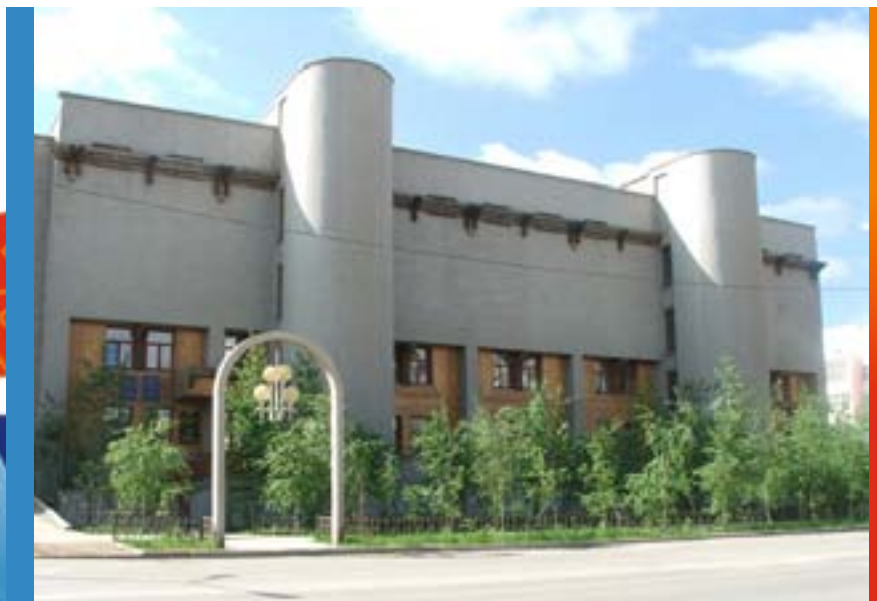
Современное здание Института гуманитарных исследований и проблем малочисленных народов Севера СО РАН

В целях систематического изучения территории Якутской АССР, истории, языка и культуры населяющих ее народов, а также для объединения и координации научных работ в республике в 1947 г. была создана Якутская научно-исследовательская база Академии наук СССР, преобразованная в 1949 г. в Якутский филиал (ныне – Якутский научный центр) Сибирского отделения АН СССР. В сентябре 1951 г. в составе Якутского филиала был создан Институт биологии, в 1957 г. – Институт геологии, в 1960 г. – Институт мерзлотоведения, в 1962 г. – Институт космофизических исследований и аэронауки и Ботанический сад.