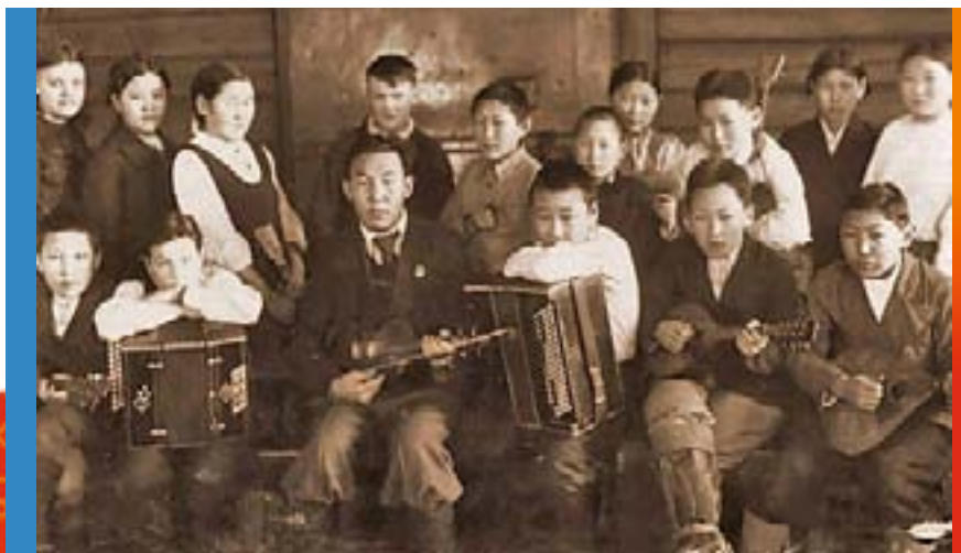
Музыкальный кружок Намской школы. 1944 г.

Развитие художественной культуры в ЯАССР достигалось усилиями не только профессиональных деятелей, но и благодаря самодеятельности широких масс. В 1983 г. действовало 23 народных театра, свыше 160 детских музыкальных школ.