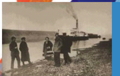
Высадка одного из отрядов Якутской экспедиции на берег Лены. 1925 г.