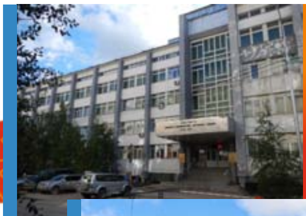
Институт физико-технических проблем Севера