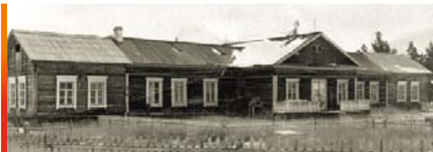
Первое административное здание Якутской научно-исследовательской мерзлотной станции