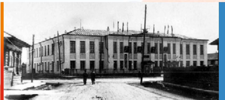
Якутский государственный педагогический институт, 1934 г.

В 1930 г. М.К. Аммосов говорил: «Проблема темпов выдвигает чрезвычайно острый вопрос о научно-идеологических кадрах в национальных республиках – вопрос о преподавателях, учителях, о научных, журналистских силах и т.д. Национальные республики чрезвычайно бедны такими командными научно-идеологическими кадрами».