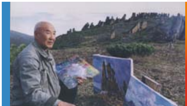
Афанасий Осипов , народный художник СССР

Важнейшим событием художественной жизни стало создание 24 января 1941 г. Союза советских художников Якутии. Появилось несколько поколений ярких мастеров изобразительного искусства, среди них Г.М. Туралысов, С.А. Александров, Л.А. Ким, А.П. Мунхалов, В.С. Карамзин, В.С. Парников и другие, составившие ядро якутского изобразительного искусства. Ведущим мастером, чье творчество широко и масштабно представляет искусство Якутии, является А.Н. Осипов, народный художник СССР.