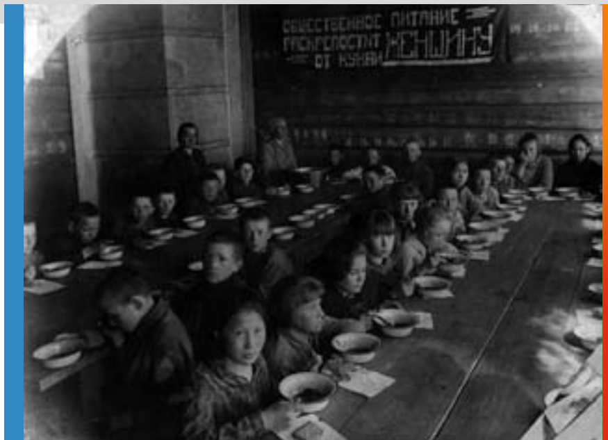
Горячий завтрак в школе

С введением всеобщего начального обязательного обучения в Якутии (с 1930 по 1941 год) была проделана огромная работа по расширению сети начальных школ. Был взят курс на глубокое и сознательное усвоение учащимися основ наук, качественное изучение русского и якутского языков и литературы, разработку научных основ методики преподавания якутского языка. В эти годы усовершенствовались алфавит и грамматика. Кроме этого, коренные народности Севера Якутии получили свою письменность. Грамотность населения в 1937 г. достигла 85,4%.