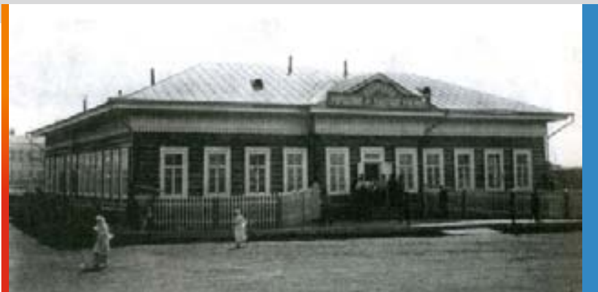
Городское четырехклассное училище. Якутск

Огромное значение имел Декрет Совета Народных Комиссаров РСФСР от 26 декабря 1919 г. «О ликвидации безграмотности среди населения РСФСР». Началось массовое обучение взрослых грамоте.