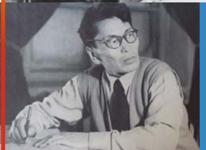
Ленин в исполнении артиста Д.Ф. Ходулова