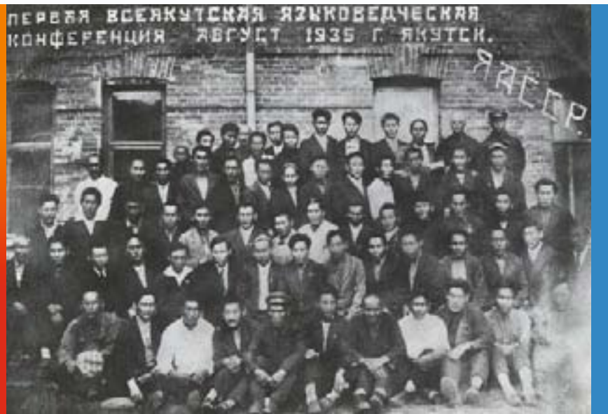
Участники I Всеякутской языковедческой конференции