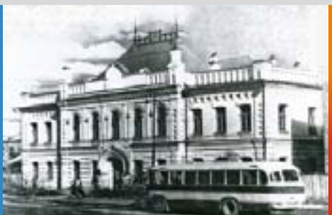
Здание ректората ЯГУ