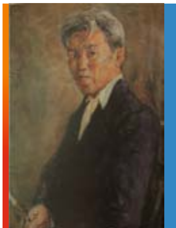
П.П. Романов – первый художник из народа саха

Якутское национальное искусство: музыка, театр, живопись – заняли заметное место в российском, советском искусстве. Появились первые профессиональные художники: И.В. Попов, М.М. Носов – выходцы из среды русского духовенства, коренные якутяне, П.П. Романов – первый художник из народа саха, основатель Якутского художественного училища. Их творчество явилось достижением в освоении традиций русского искусства на якутской земле.