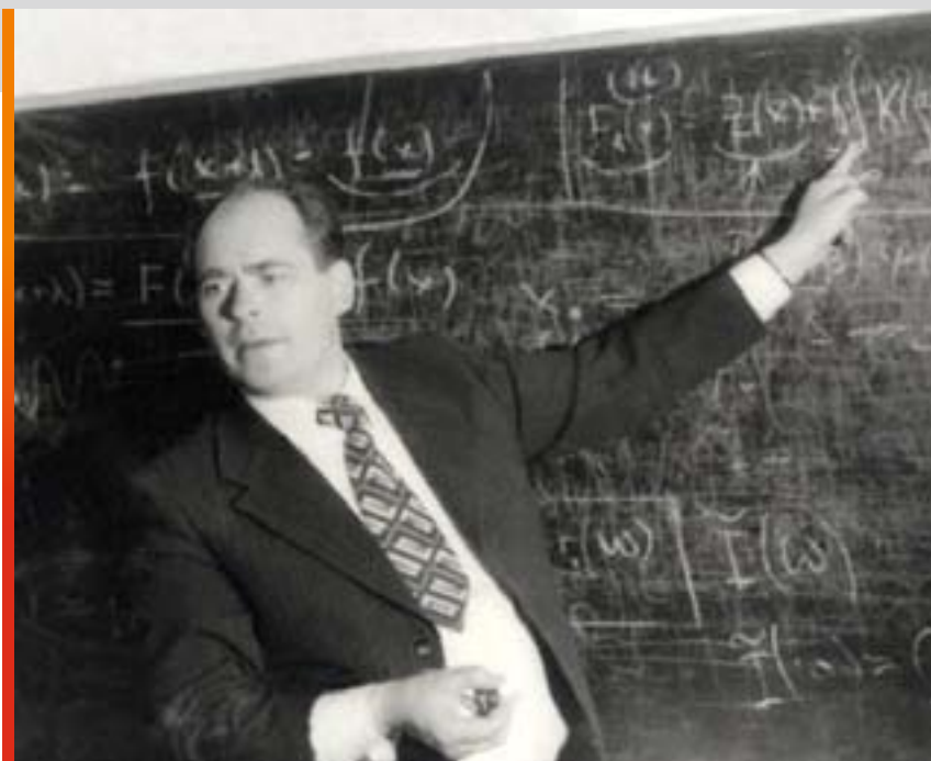
Академик Г.Ф. Крымский