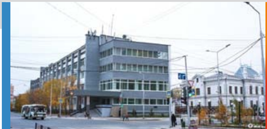
Институт космофизических исследований и аэронауки